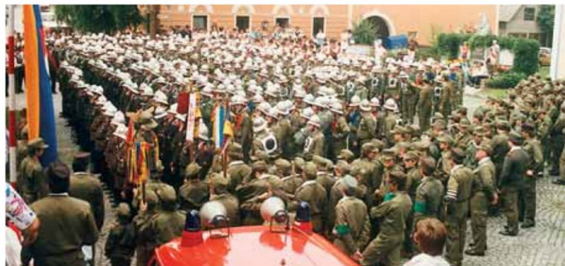
1986 – Bezirksfeuerwehrleistungsbewerb – Siegereverenz

Daher holten wir den Bezirksfeuerwehrleistungsbewerb nach Nöchling, welcher das letzte Mal im Jahr 1986 stattfand.