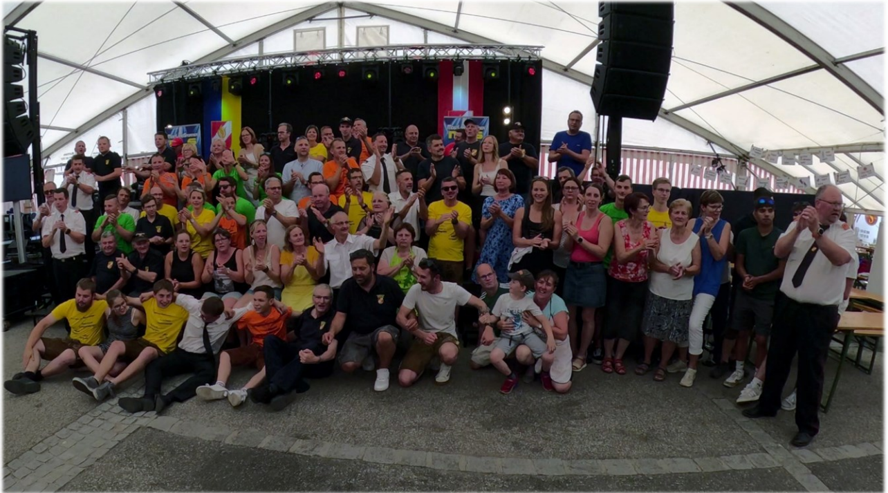
Foto Helfer beim Bezirksfeuerwehrleistungsbewerb Juni 2025 Nöchling