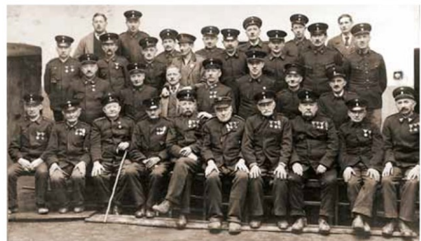
1938 – Mannschaft

Daher holten wir den Bezirksfeuerwehrleistungsbewerb nach Nöchling, welcher das letzte Mal im Jahr 1986 stattfand.