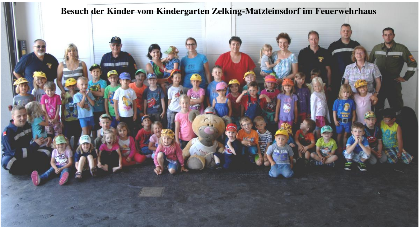
Besuch der Kinder vom Kindergarten Zelking-Matzleinsdorf im Feuerwehrhaus