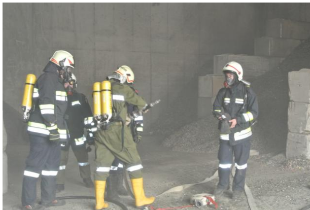
Brand Umwelanstalt Wörth

Bei den Einsätzen 2014 wurden von unseren Kameraden 792 Einsatzstunden mit 314 eingesetzten FF-Männern geleistet!