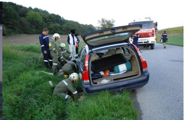
VU auf der Lst. Ri. Ornding