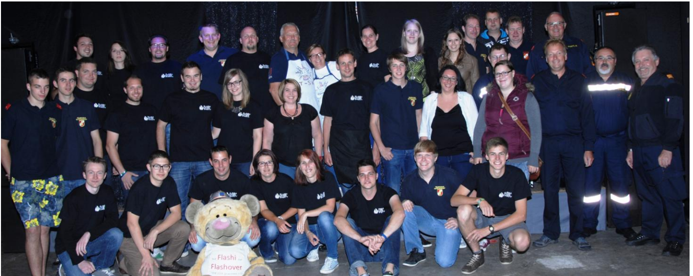
Die freiwilligen Helfer der Flash Over Party- Krone Hit Vibrations Night

Für den Freitag, den 20.06.2014 , wurde in Zusammenarbeit mit dem Radiosender „Krone Hit Radio“ die Flash Over Party organisiert. Viele Stunden der monatelangen Vorbereitung wurden in Plakatgestaltung, Sponsoring, Werbung, Festhallengestaltung usw. investiert, und es sollte sich auszahlen. Über 800 Besucher kamen und feierten bis in die frühen Morgenstunden diesen Event. Da der Erfolg dieses Konzept schon 4 Mal bestätigt hat, wird es auch 2015 die „Flashover Party“ geben. Nochmals danke an alle Mitwirkenden, Sponsoren und Helfer.