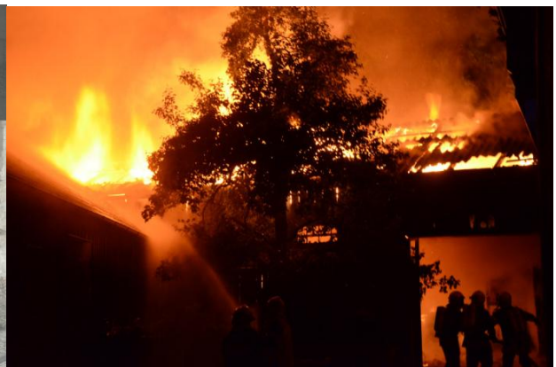
Brandeingang in Gossam