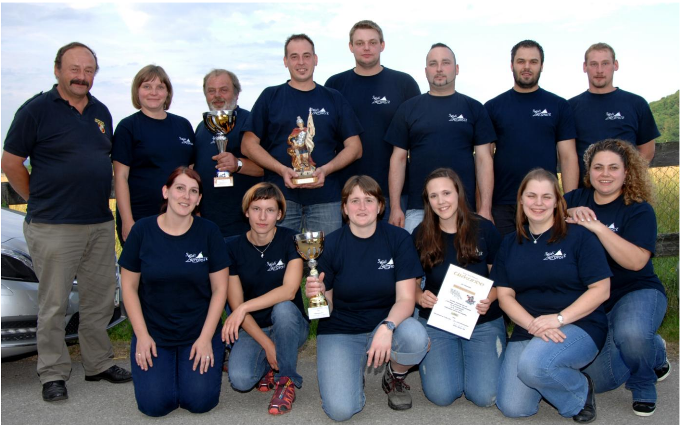
Die siegreichen Mannschaften vom „wilden Bergvolk“ aus Heiligenblut

Wie schon die Jahre zuvor begann die Veranstaltung am Donnerstag bei relativ schönem Wetter mit dem schon traditionellen Seilziehturnier am Sportplatz. Nach einer halben Stunde begann es leider zu regnen und wir mussten in unser Festzelt ausweichen. Nach einer Umbauzeit von 10 Minuten konnte der Bewerb fortgeführt werden. Nach sehr spannenden Duellen gewannen bei den Damen und den Herren die Gruppen aus Heiligenblut den 6.Hiesbergcup.